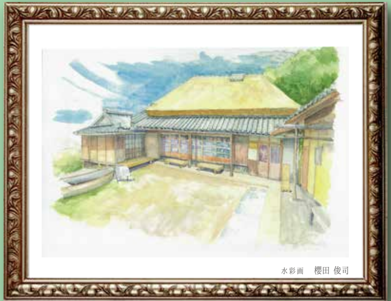
水彩画 櫻田 俊司

Yumeji Music Competition in SETOUCHI CITY