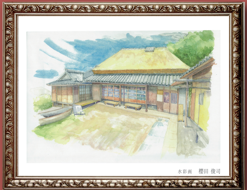
水彩画 櫻田 俊司